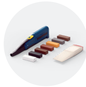
Kit de réparation QSREPAIR