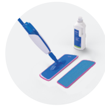
Kit de nettoyage QSSPRAYKIT