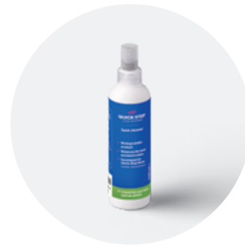
Spot Cleaner 250 ml QSSPOTCLEAN