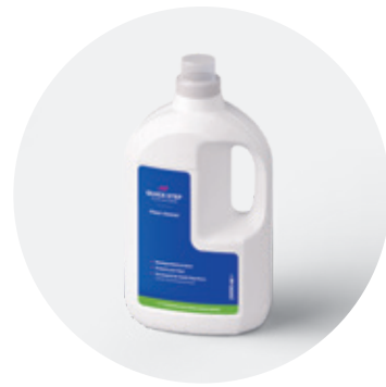
Floor cleaner 1 litre ou 2 litres QSCLEANECO1000 QSCLEANECO2000